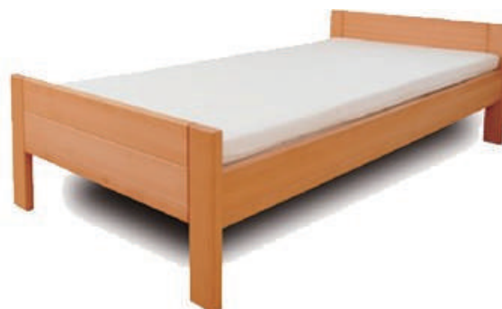
● コンフォートベッドフレーム(ヒュスラー)