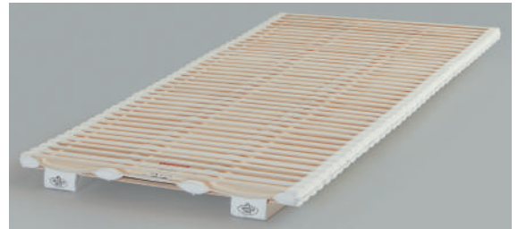
リフォーマエレメント、2重の板バネが体を支えます